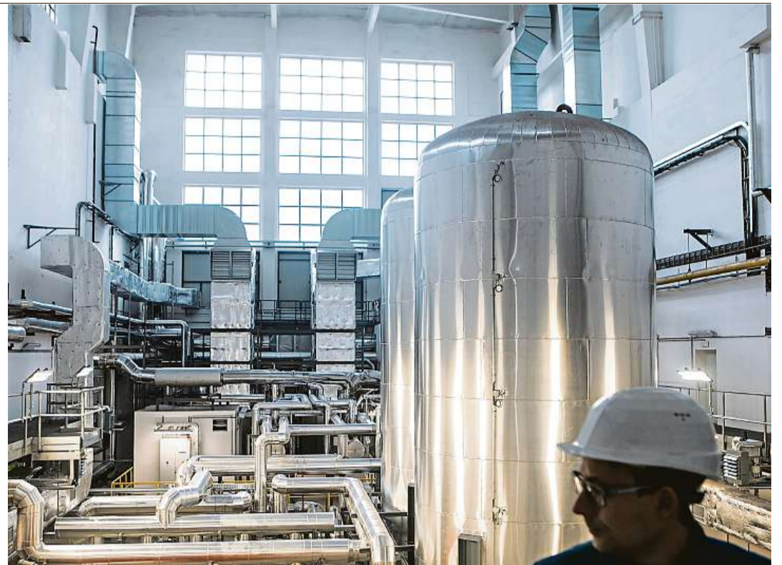
Vyleštěné kotle Spousta nerezů a všude čisto, to je nová náhodská teplárna.

Podle teplárny však odpovídaly dosavadní ceny za teplo v Náchodě tuzemskému průměru. Odvíjejí se